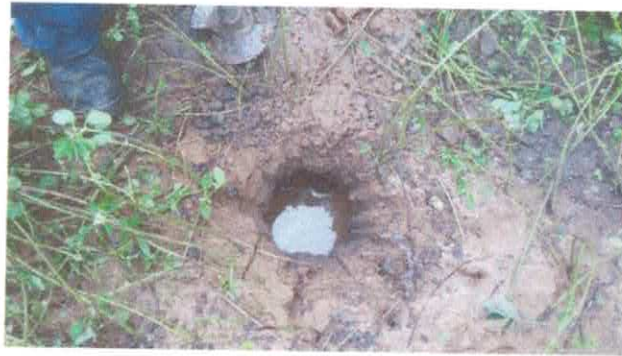
Início do furo com nível d'água