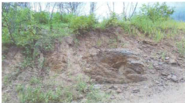
Afloramentos rochoso próximo ao furo.