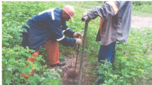
Furo as margens do riacho