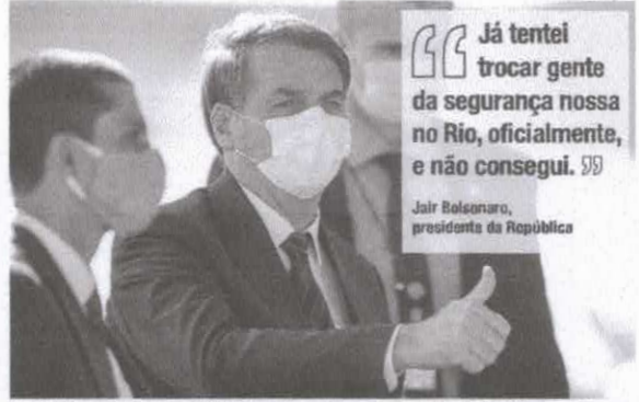
Presidente Jair Bolsonaro tem mostrando confiança de que não cometeu nenhum delito na questão da PF

Um dos desafios da investigação é identificar quem em específico ele buscava eventualmente beneficiar e em quais processos. Isso dependerá de diligências ainda pendentes, como depoimentos de testemunhas. Segundo