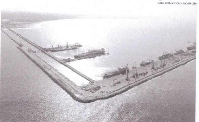
O resultado da pesquisa demonstra que o Ceará vem conseguindo recuperar a sua economia de maneira acelerada

O estudo que marca o dia do comércio exterior, que ocorre hoje, apresenta um crescimento positivo no setor de 2,4% se comparado a 2019