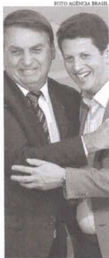
Presidente Jair Bolsonaro ao lado do ministro do Meio Ambiente, Ricardo Salles, durante lançamento do programa

Em seu pronunciamento, Bolsonaro comemorou a adesão da primeira empresa ao programa e disse que o programa está despertando o interesse de empresários. "Que nós podemos falar para aqueles que nos criticam que nós não temos condições, por questões econômicas, de atender nessa área. Venham nos ajudar. E uma empresa francesa foi a primeira que apareceu, é um marco para nós, é uma prova [de] que o projeto do Ricardo Salles é bem-vindo e despertou a atenção e o interesse de muitos empresários. Outros estão a caminho já bastante avançado", afirmou. A cerimônia no Palácio do Planalto contou com a participação de diversos ministros e parlamentares. O vice-presidente Hamilton Mourão, que atualmente preside o Conselho da Amazônia, não participou do evento, (todas as matérias são da Agência Brasil).