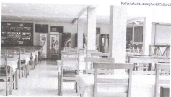
No Brasil, mais de 180 mil postos de trabalho foram fechados em 2020 devido às medidas de restrição

Amargando perdas e prejuízos incalculáveis desde o início das medidas de restrição de pessoas devido à pandemia do novo coronavírus, que começou em março de 2020, o setor de alimentação fora do lar no Ceará volta a apelar pelo direito de trabalhar. Desde o início deste mês, em razão das medidas contra a aglomeração no período do Carnaval, bares, restaurantes e barracas de praia estão com horário de funcionamento reduzido até às 20 horas na semana e até às 15 horas aos sábados e domingos. O decreto estadual foi renovado no último dia 17 em razão do aumento de casos relacionados à Covid-19 e lotação das unidades de saúde no Estado. No entanto, o setor lamenta pelo fechamento de estabelecimentos e risco de demissões. Neste final de semana, em ação organizada pela Associação Brasileira de Bares e Restaurantes no Ceará (Abrasel), colaboradores de bares e restaurantes, no estado, pediram pelo direito de trabalhar. A ação faz parte da campanha "Restaurantes pela vida e pelo trabalho", diante cenário de preocupação por parte dos empresários do setor. Um dos mais tradicionais bares de Fortaleza, o Pirata Bar, reuniu parte dos seus funcionários para lamentar a redução da equipe devido à crise gerada pela pandemia. No vídeo, a auxiliar de cozi-