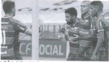
LEÃO DE AÇO Fortaleza goleia Caucaia por 4 a 1 no sábado que passou, na Arena Castelão. Poderia ter sido mais, se não fosse a atuação espetacular do goleiro Uston.

A opinião de um amigo muito ligado aos meios de televisão, que me disse: "Bechura vai decolar".