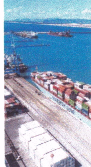
POTENCIAL do Porto do Pecém é destacado por investidores

IRNA CAVALCANTE irnacavalante@opovo.com.br