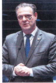
FÁVARO é senador pelo PSD do Mato Grosso

O senador Carlos Fávaro (PSD-MT) será o ministro da Agricultura do governo Luiz Inácio Lula da Silva. A nomeação, que já era a mais cotada entre os candidatos ao posto, foi confirmada pela reportagem por membros da cúpula do governo petista. Há previsão de que o deputado Neri Geller (PP-MT) seja seu secretário executivo na pasta, mas isso ainda não foi fechado.