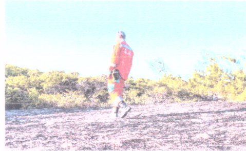
TRÊS incêndios foram registrados no Parque da Sabiaguaba em dois meses

BRUNA LIRA ESPECIAL PARA O POVO brunalira@opovo.com.br