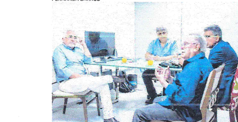
PARCERIA vai fomentar o debate econômico na sociedade

a comunicação. "Quando vem esta união, quem ganha é a sociedade, por meio de diversas ações que podem ser desenvolvidas agora e para frente".