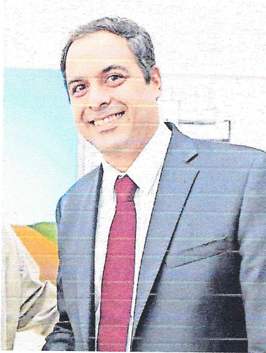
CÂMARA foi indicado por Lula para o cargo

ESTADO DO CEARÁ - PREFEITURA MUNICIPAL DE GENERAL SAMPÃO - AVISO DE LICITAÇÃO - PREÇO ELETRÔNICO Nº 2023.01.24.01 - A Prefeitura Municipal de General Sampaó, localizada no Município de General Sampaó, Ceará, através da Comissão de Licitação, abre o Edital nº 001/2023 para aquisição de materiais de consumo para atender às necessidades das Unidades Administrativas da Prefeitura Municipal de General Sampaó, Ceará, no valor estimado de R$ 2.500.000,00. O prazo para apresentação de propostas é até o dia 28 de Fevereiro de 2023, às 14h00. O local para apresentação das propostas é o endereço: Rua José de Alencar, nº 100, Centro, General Sampaó, Ceará. Mais informações, consulte o Edital nº 001/2023, disponível em: www.pmpgsa.com.br .