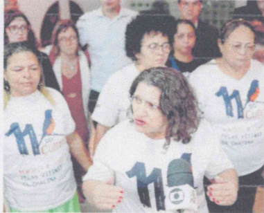
MÃES das vítimas da chacina acompanharam o julgamento

Após a conclusão da primeira etapa do julgamento da Chacina do Curió, o governador Elmano de Freitas (PT) anunciou nessa segunda-feira, 26, que a Procuradoria-Geral do Ceará deve procurar as familiares das vítimas assassinadas no massacre, ocorrido em novembro de 2015, para propor um acordo de indenização coletiva. O Estado é alvo de ações reparatórias movidas pela Defensoria Pública do Ceará entre 2017 e 2019.