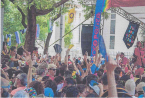
CEARÁ ocupa a 11ª posição no ranking nacional de maior movimentação financeira, segundo a CNC

Em contrapartida, o Ceará é um dos estados que terá o menor crescimento, com uma projeção de 3%, segundo o estudo. Em seguida, o Espírito Santo projeta uma alta de apenas 2,5%. E em último lugar, o estado de Pernambuco projeta uma ampliação de 1,8% na data comemorativa.