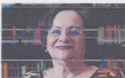
MARIA DA PENHA

ASSISTA ONLINE NO CANAL FDR: WWW.FDR.ORG.BR/CANALFDR CANAL FDR: 48.1 (ABERTO) | 23 (MULTIPLAY) | 138 (BRISANET) | 523 (HD, NET) | 24 (SD, NET)