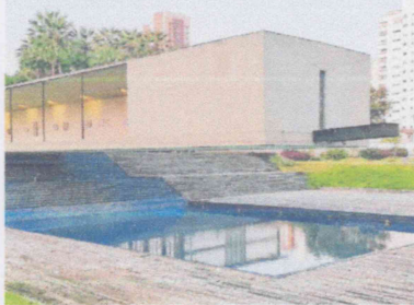
MAUSOLÉU Castelo Branco será retirado do Palácio da Abolição

Elmano de Freitas (PT) afirmou que o Governo do Estado dará início à "licitação para fazer as alterações" no Mausoléu Castelo Branco. Em visita ao O POVO na última quarta-feira, o chefe do Executivo explicou que o equipamento deve "homenagear os membros da luta pela abolição" do Estado.