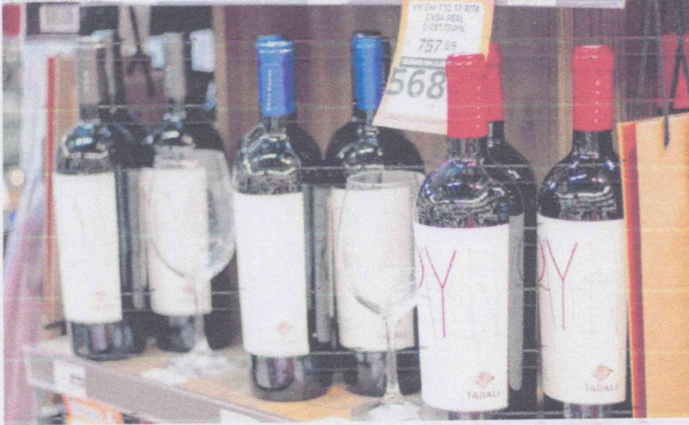
VINHOS estão entre os produtos pesquisados