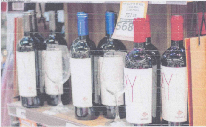
VINHOS estão entre os produtos pesquisados