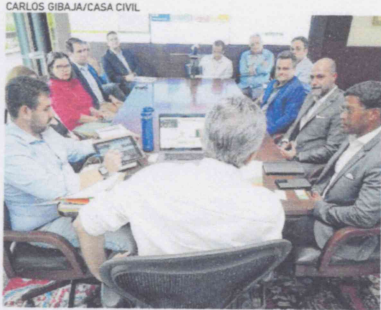
REUNIÃO entre governador e executivos da Angola Cables para o anúncio do novo data center

A construção amplia a infraestrutura para o abastecimento de conexões, o que garante uma maior fluidez do tráfego de informações, atendendo as demandas de dados de conteúdos e negócios.