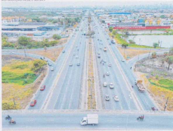
BR-114, uma das rodovias mais movimentadas do Ceará

LUCAS BARBOSA lucas.barbosa@opovo.com.br