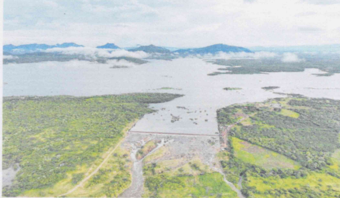
ÁÇUDE Edson Queiroz, em Santa Quitéria, sangrou ontem

ALEXIA VIEIRA alexia.vieira@opovo.com.br