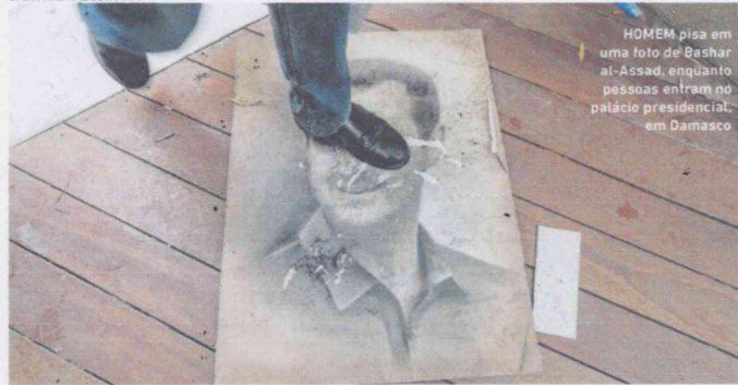
HOMEM pisa em uma foto de Bashar al-Assad, enquanto pessoas entram no palácio presidencial, em Damasco