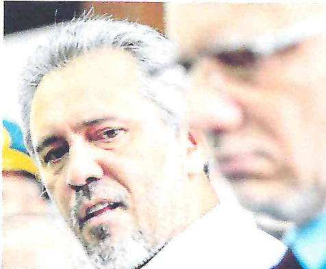
NA FOTO, o governador Elmano e o secretário da Segurança Pública, Roberto Sá

O governador do Estado do Ceará, Elmano de Freitas (PT), participou na manhã desta segunda-feira, 3, da abertura oficial dos trabalhos da Assembleia Legislativa do Estado do Ceará (ALECE) para o biênio 2023-2025, e aproveitou a ocasião para reconhecer as dificuldades na área da segurança pública. A situação, segundo ele, o deixa “muito insatisfeito”.