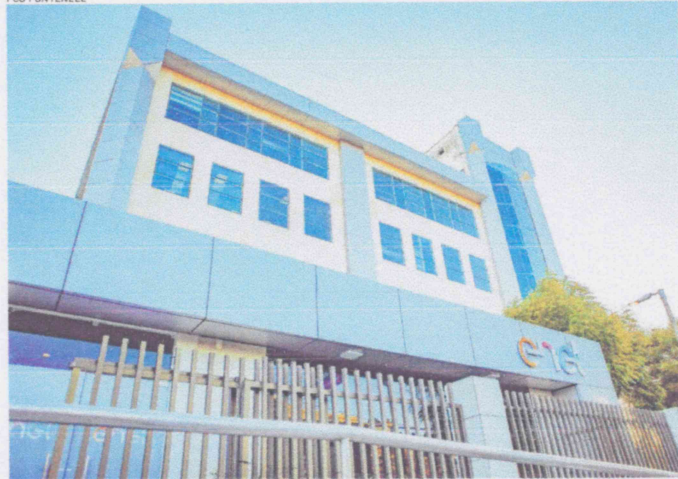
COMPANHIA fez pedido de renovação da concessão que iria até 2028, no Ceará

Estado do Ceará - Prefeitura Municipal de Pedra Branca - Aviso de Licitação - Pregão Nº 015002-PE/SP O Serviço Autônomo de Água e Esgoto - SAAE, através do seu Preposto, torna público que realizará às 08:30h, do dia 11 de Abril de 2025, no endereço eletrônico https://compras.m24tecnologia.com.br/ , Pregão Eletrônico nº 015002-PE/SP. Objeto: Aquisição de material hidráulico, destinado às intervenções realizadas pelo Serviço Autônomo de Água e Esgoto - SAAE, do Município de Pedra Branca/CE. O Edital e seus anexos estão disponíveis, na íntegra, nos endereços eletrônicos www.pedrabranca.ce.gov.br/ e https://compras.m24tecnologia.com.br/ . Informações: pedrabranca@pedrabranca.ce.gov.br e https://compras.m24tecnologia.com.br/ . Horário de atendimento: das 08:00h às 17:00h. Pregoeiro: Pedro Branca - CE em 28 de Março de 2025.