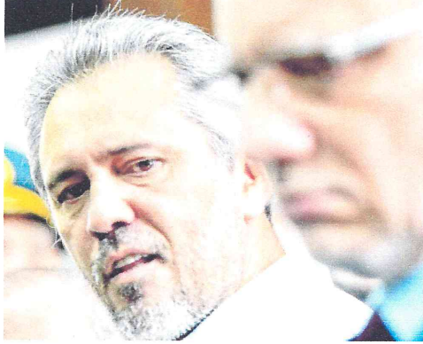
NA FOTO, o governador Elmano e o secretário da Segurança Pública, Roberto Sá

O governador do Estado do Ceará, Elmano de Freitas (PT), participou na manhã desta segunda-feira, 3, da abertura oficial dos trabalhos da Assembleia Legislativa do Estado do Ceará (Alec) para o biênio 2025-2026, e aproveitou a ocasião para reconhecer as dificuldades na área da segurança pública. A situação, segundo ele, o deixa "muito insatisfeito".